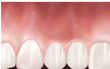
Ausgangssituation mit Verlust von befestigtem Zahnfleisch.

Verlust von befestigtem Zahnfleisch kann häufig mit einem geeigneten chirurgischen Ansatz behandelt werden. Ihr Arzt berät Sie hinsichtlich der für Sie individuell passenden Behandlung.