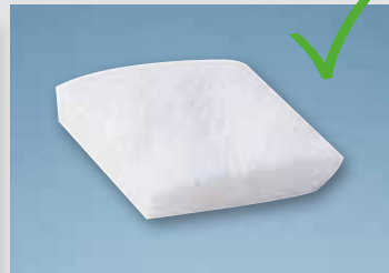
... wird mit Geistlich Mucograft® vermieden.