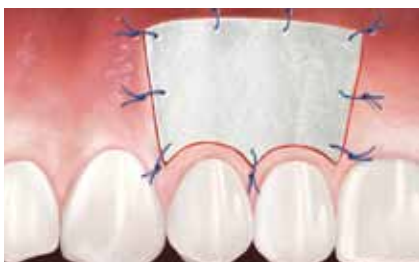
Geistlich Mucograft® wird in die betroffene Region eingebracht und dient als Leitschiene für das neu wachsende Gewebe.