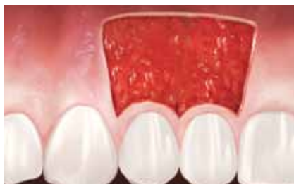
Ein chirurgischer Ansatz schafft die biologischen Voraussetzungen zur Regeneration von befestigtem Zahnfleisch.