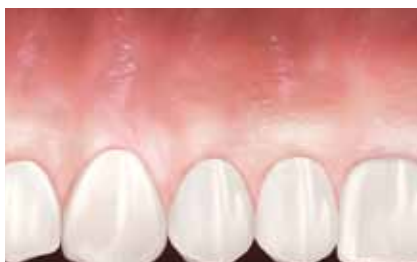
Ausreichend befestigtes Zahnfleisch nach Heilung (Resultate können je nach Ausgangssituation variieren).

ES IST WICHTIG , vor der chirurgischen Behandlung bestehende Entzündungen zu therapieren. Ihr Arzt wird Ihnen eine individuelle Behandlung empfehlen, wie z. B. die Durchführung von Prophylaxebehandlungen oder die Anwendung von Mundspüllösungen.