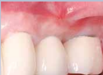
Ziel der Behandlung ist die Schaffung von befestigtem und widerstandsfähigem Zahnfleisch (Dr. A. Charles).