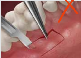
Die Entnahme von Weichgewebe aus dem Gaumen ...