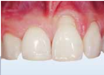
Zahnfleischrückgang und freiliegender Zahnhals (Dr. N. Braz de Oliveira).

bedeutet weniger Schmerzen und höhere Lebensqualität