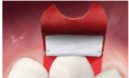
Geistlich Mucograft® wird in die betroffene Region eingebracht, um das Gewebe zu stabilisieren.