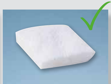
... wird mit Geistlich Mucograft® vermieden.