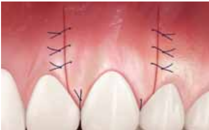
Der Weichteillappen wird über den freiliegenden Zahnhs gelegt und vernäht.