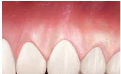
Ergebnis einer vollständigen Deckung nach Heilung (Resultate können je nach Ausgangssituation variieren).

ES IST WICHTIG , die Ursache des Zahnfleischschwunds vor einer chirurgischen Behandlung anzugehen. Ihr behandelnder Arzt wird Ihnen eine individuelle Behandlungsmethode empfehlen, wie beispielsweise die Änderung des Putzverhaltens oder die Notwendigkeit einer kieferorthopädischen Vorbehandlung.