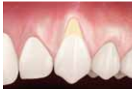
Mögliche Situation ohne Behandlung.