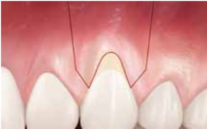
Chirurgische Bildung eines Weichteillappens für die Behandlung eines Zahnfleischschwunds.

Zahnfleischrückgang kann häufig mit einem geeigneten chirurgischen Ansatz behandelt werden. Ihr Arzt berät Sie hinsichtlich der für Sie individuell passenden Behandlung.