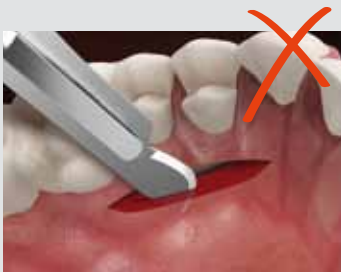
Die Entnahme von Weichgewebe aus dem Gaumen ...